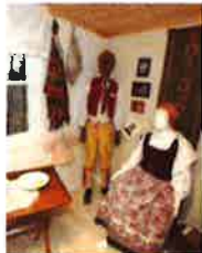
Bollebygds hembygdsförening visar sina samlingar.

Anne Engström tipsar om fem saker i Bollebygd i veckan.